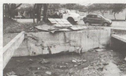
Arroio Montenegro recebeu macrodrenagem